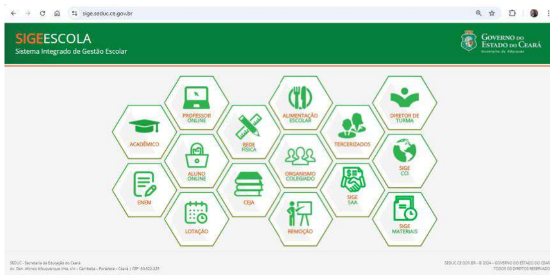
Figura 1 – Tela inicial do SIGE, evidenciando todas as funcionalidades disponíveis do Sistema

materiais, organismos colegiados, dentre outras utilidades, como mostrado na Figura 1, que corresponde à tela inicial, contendo todos os módulos.