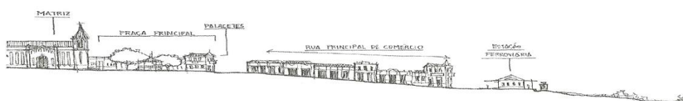
Figura 01. Cenário comum nas cidades fruto da expansão ferroviária do Oeste Paulista.