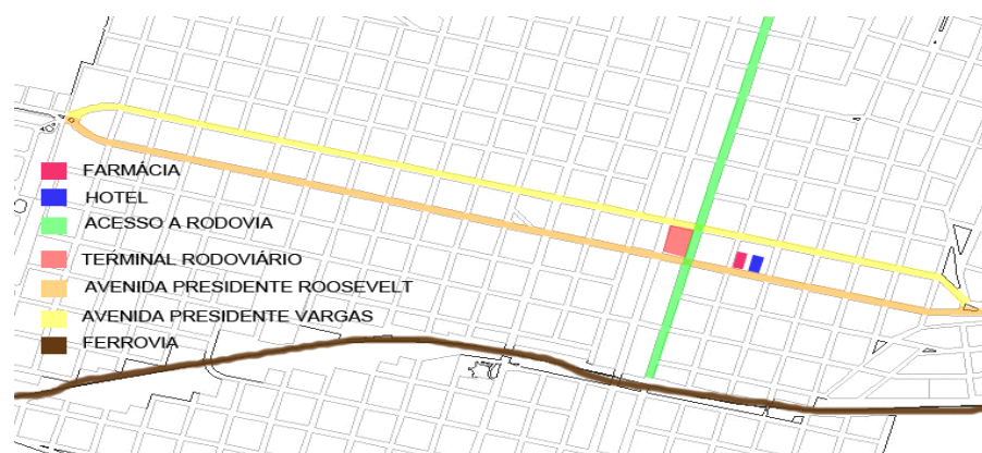
Figura 02. Localização do primeiro hotel e primeira farmácia.

Através do levantamento fotográfico, foi possível a elaboração de “mapas croquis” e comparações fotográficas afim de identificar o estado de preservação das edificações do centro histórico de Dracena. Para tal análise, foram estabelecidos quatro recortes temporais que representaram mudanças significativas na estrutura urbana da cidade. O primeiro recorte identifica os três primeiros anos da cidade, tendo como edificações importantes apenas o Hotel Municipal e a Farmácia, ambos edificadas em madeira (Figura 02).