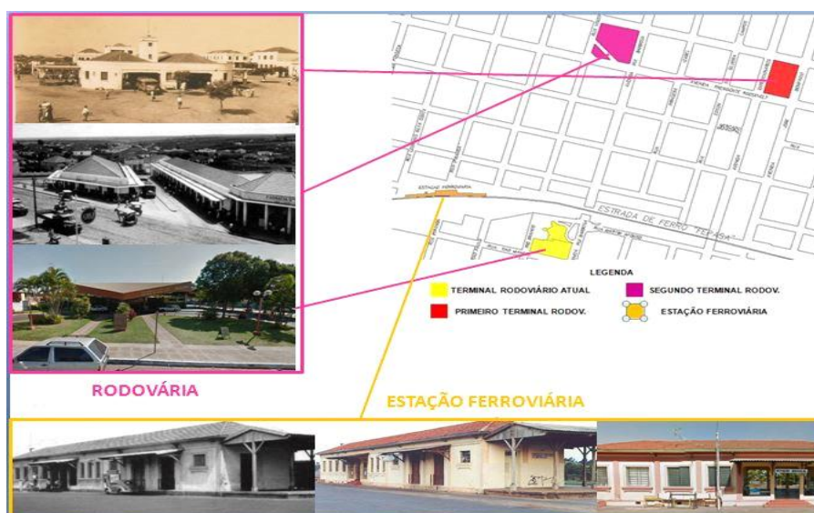
Figura 5. Situação atual das edificações históricas (1955 - 1960) do núcleo urbano inicial de Dracena.

espaço, dando lugar à Praça da Bandeira. É neste cenário que chega o primeiro trem da Companhia Paulista de Estradas de Ferro, alterando a estrutura urbana de Dracena e contribuindo para sua evolução.