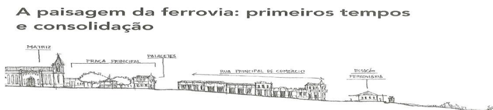
Figura 1. Cenário comum nas cidades fruto da expansão ferroviária do Oeste Paulista.

Para Marx (1980), o avanço acelerado da marcha do café, no oeste do estado com as características do meio de transporte, o ferroviário, devido as suas exigências do seu trajeto e a necessidade de realizarem rapidamente o parcelamento do solo para venda imediata, determinaram a produção de um novo cenário urbano monótono e regular (Figura 1)