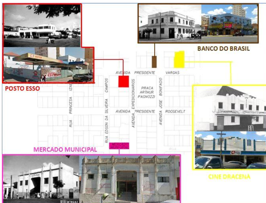
Figura 4. Situação atual das edificações históricas (1950 - 1955) do núcleo urbano inicial de Dracena.

Fonte: Base cartográfica fornecida pela Prefeitura Municipal de Dracena e editada pela autora.