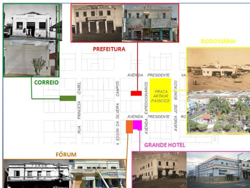
Figura 3. Situação atual das edificações históricas (1948 – 1950) do núcleo urbano inicial de Dracena.

seu entorno, como a Prefeitura Municipal, Hotel Municipal, os Correios e o Fórum (Figura 3).