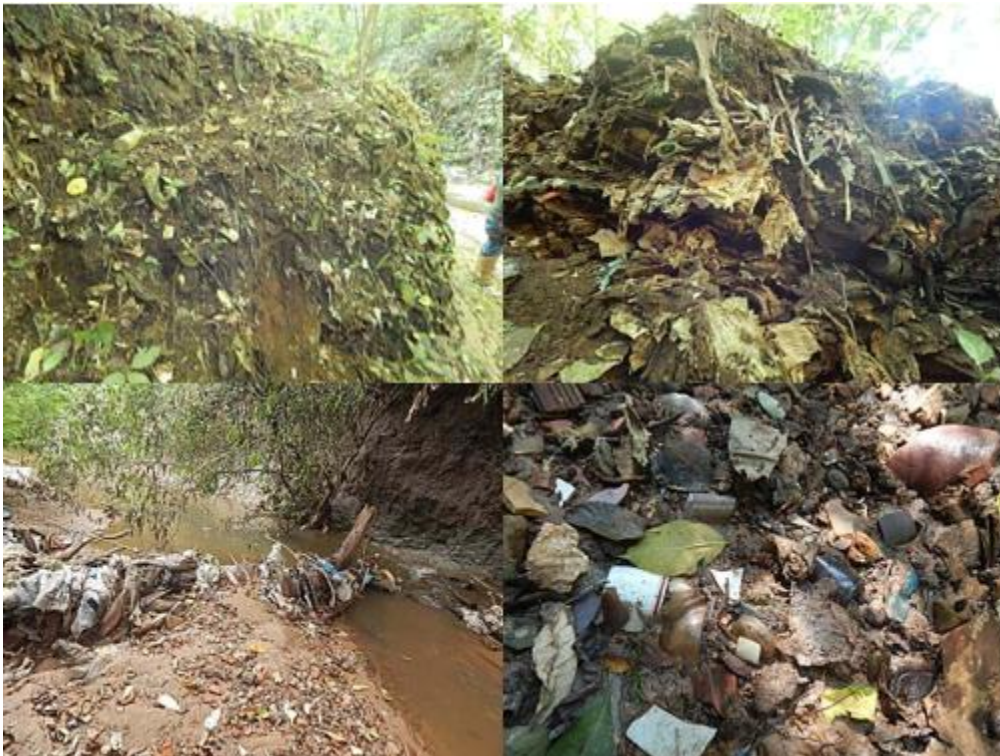
Figura 5. Mosaico de imagens de materiais tecnogênicos oriundo do antigo lixão em afluentes a jusante dos pontos de coletas de amostras.

Os resultados, que se encontram desconsoantes com a Resolução CONAMA 357/2005 e CETESB com a quantidade de coliformes totais, DBO, fósforo, N-NH 3 e condutividade, podem indicar poluição por esgotos domésticos. Os detergentes superfosfatados utilizados em grandes quantidades domesticamente constituem a principal fonte de fósforo, provavelmente das residências dos bairros a montante e circunvizinhos. As águas drenadas em áreas agrícolas e urbanas também podem causar a presença excessiva de fósforo em águas naturais (CETESB, 2008; CHAGAS et al. , 2017; VIEIRA, 2018; SANTOS et al. , 2018). Outro fator que talvez possa estar influenciando nos parâmetros fora das normas da CONAMA 357/2005 e CETESB-2008 seja que no passado a área foi um lixão de resíduos domiciliares, na qual os lixiviados (chorume e água de infiltração) ainda possibilitam a contaminação do solo e água subterrânea e superficial (MISHRA et al. , 2018).