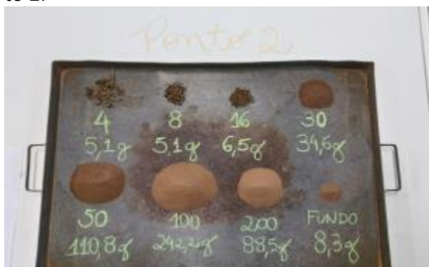
Figura 6. Tamanhos de peneiras utilizadas e seus respectivos pesos finais de solos no ponto 2.