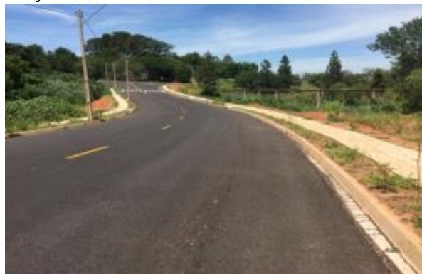
Figura 13. Intervenção em área de APP- construção de vias.

Como observado, a construção e o estabelecimento de um empreendimento trazem diversos impactos negativos ao meio ambiente, em especial quando construído tão próximo de uma APP como no local de estudo, visto que devido à presença desse condomínio foram construídas novas vias de acesso que passam sob o leito do rio (figura 13), interferindo diretamente no escoamento natural deste corpo hídrico.