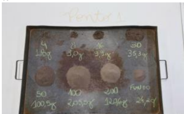
Figura 5. Tamanhos de peneiras utilizadas e seus respectivos pesos finais de solos no ponto 1.

ra, como demonstra as figuras (5, 6 e 7), pode-se então ser determinado o tipo de solo predominante em cada um dos pontos, através de cálculos.