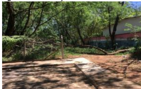
Figura 10. Intervenção em área de APP

154/08 de acordo com a largura do afluente, agredindo diretamente o ecossistema local, e modificando a paisagem natural.