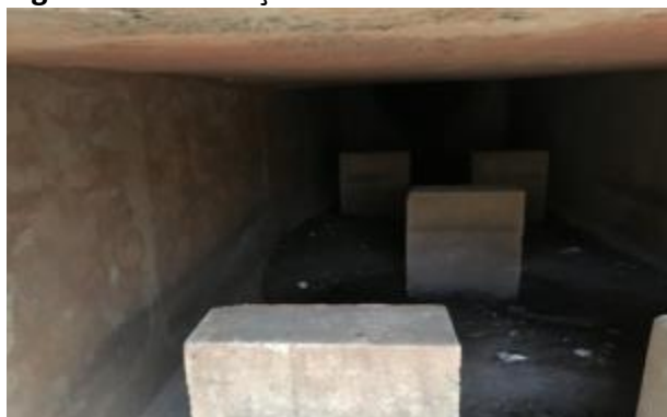
Figura 9. Canalização da nascente

O primeiro impacto a ser analisado é que a nascente e uma parte do afluente encontram-se canalizados (Figura 9) para a construção de vias, e tal fator pode causar diversos problemas à fauna aquática e a população local. Isso porque a canalização faz com que a água não infiltre no solo, alterando o seu fluxo hídrico natural, fazendo com que em época de fortes chuvas ocorra o transbordamento e provoque enchentes.