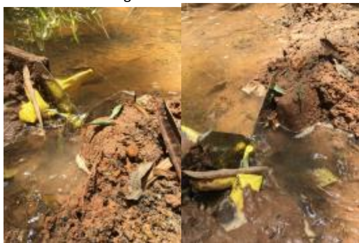
Figura 4. Tipo de vertedor utilizado e a água formando um “véu de noiva” ao extrapolar.