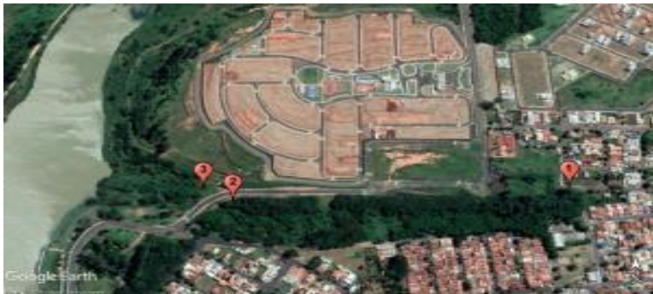
Figura 2. Pontos de coletas do solo para análise granulométrica na microbacia afluente do Córrego do Limoeiro em Presidente Prudente – SP

No dia seguinte a coleta, as amostras de solo foram encaminhadas para o laboratório da Universidade do Oeste Paulista e mantidas em estufa com temperatura de até 110° C até o dia do experimento.