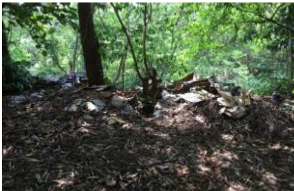
Figura 11. Descarte irregular de resíduos sólidos na área de APP.