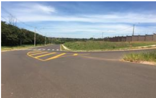
Figura 12. Construção do condomínio próximo à área de APP.

Segundo Santos ( apud Batista et al. , 2013, p. 8), a construção civil é responsável por consumir entre 20% a 50% de todos os recursos naturais utilizados pela sociedade.