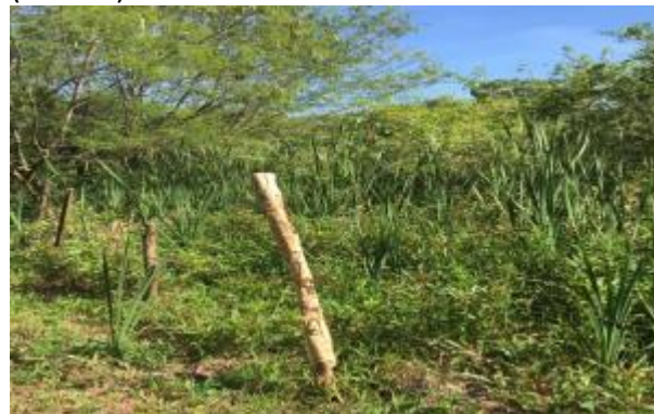
Figura 15. Presença de espécies invasoras (taboas).

No ponto mais a jusante desse afluente é possível observar um número elevado de taboas (figura 15), que são consideradas espécies vegetais invasoras. Essas se encontram fora da sua área de distribuição natural ameaçando ecossistemas, habitats e levando até a extinção de espécies, além de ser um indicativo que o terreno pode sofrer fácil processos de assoreamento.