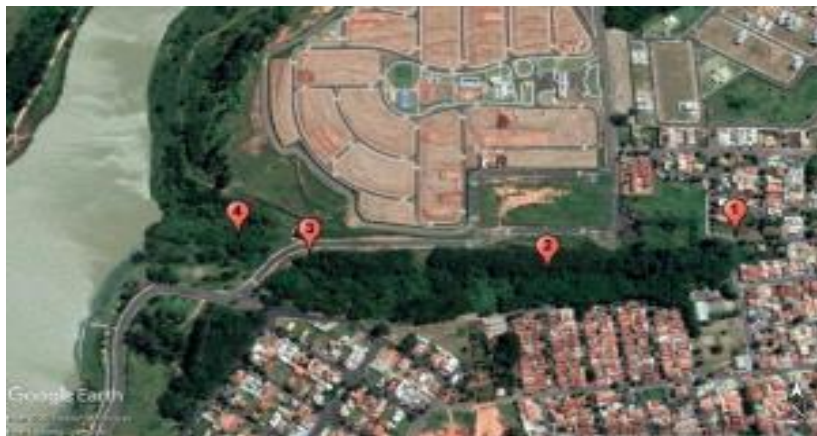
Figura 1. Pontos de coletas para análise de qualidade da água no afluente do córrego do Limoeiro Presidente Prudente – SP