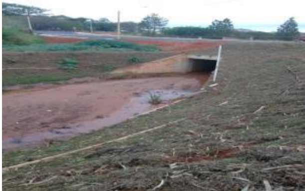
Figura 14. Processo de assoreamento no afluente do Córrego do Limoeiro.