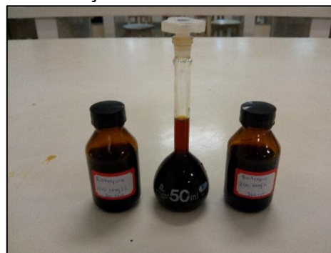
Figura 1. Diluição do Tanfloc SG

Na etapa 2 primeiramente foi feita a diluição da solução comercial do Tanfloc SG doado pela empresa Tanac S/A. A solução comercial tinha uma concentração de 1000 \text{ mg.L}^{-1} , e foram feitas diluições de 200 \text{ mg.L}^{-1} (figura 1) para que fosse possível a aplicação do coagulante em escala de bancada. Após a diluição, foram testadas as concentrações de 0,5 a 3 \text{ mg.L}^{-1} do coagulante orgânico como aditivo de coagulação ao PAC em ensaios Jart-test (figura 2), este com reduções de sua concentração ótima proporcionais ao usado com Tanfloc SG.