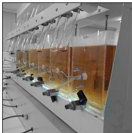
Figura 2. Ensaios Jartest