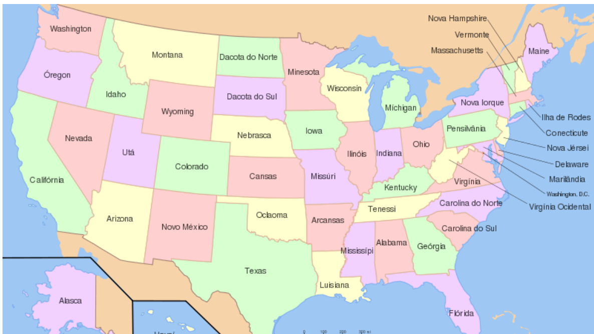
Figura 3. Mapa dos Estados Unidos mostrando a localização dos laboratórios onde foram estudadas as mutações para o gene p53, descritas no presente estudo. Nota-se uma relativa concentração de dados provenientes das regiões costeiras do Atlântico e do Pacífico, e praticamente inexistência de dados provenientes do Meio-Oeste e da região Sul dos EUA.

momento da pesquisa, ainda não foram coletadas informações pessoais sobre os pacientes. Entretanto, já está disponível um considerável volume de informações sobre o sequenciamento do material coletado.